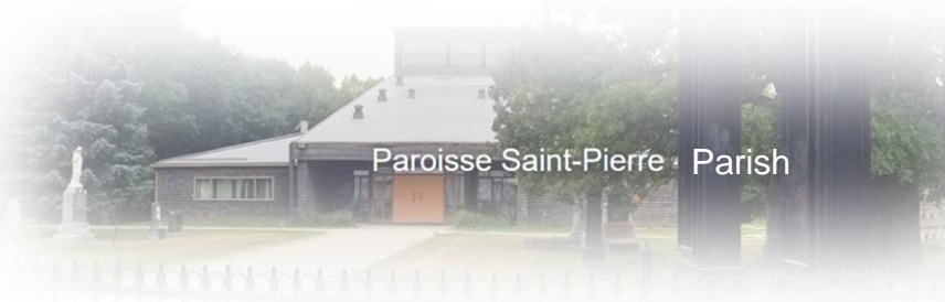
Paroisse Saint-Pierre Parish