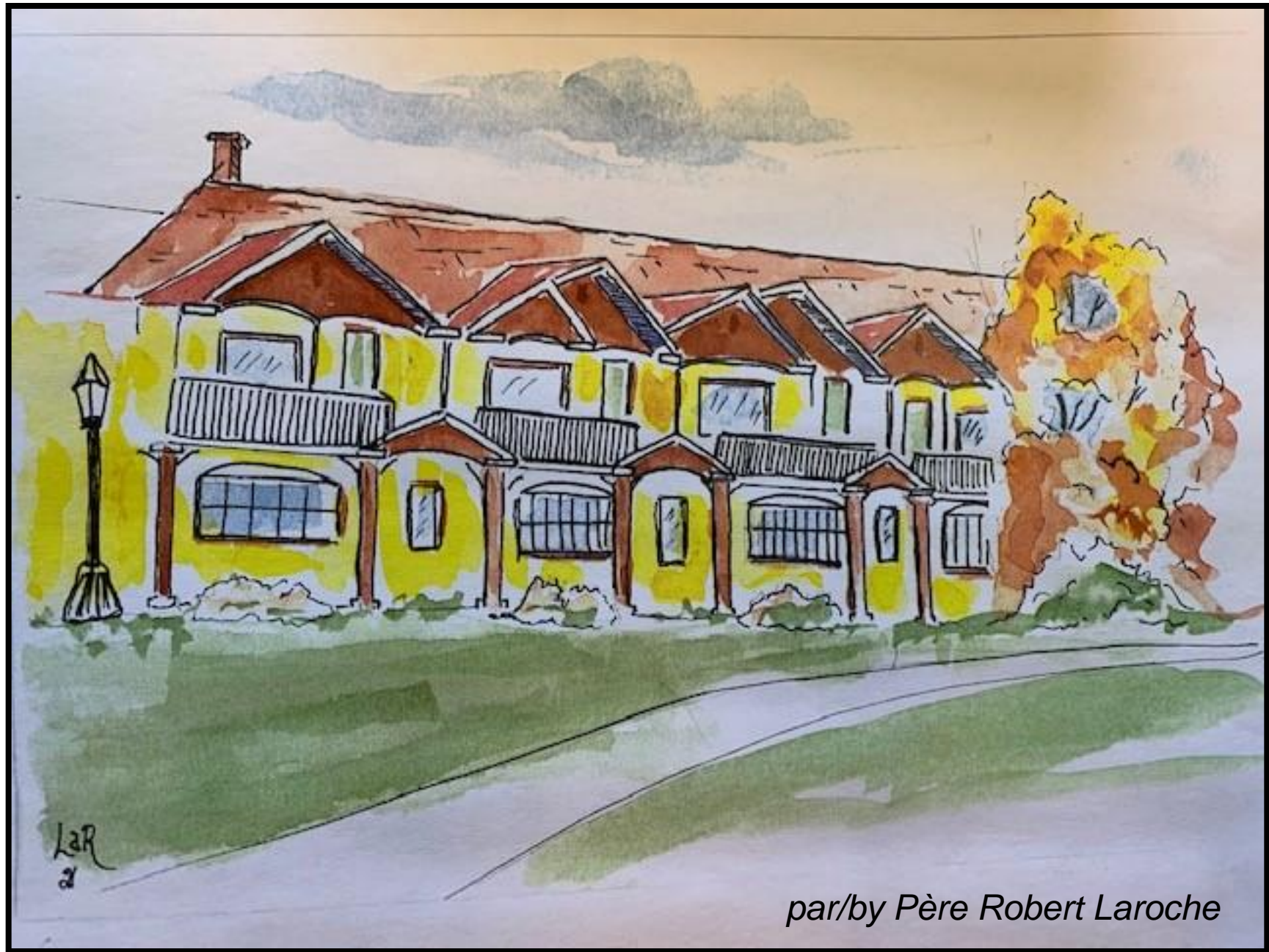
par/by Père Robert Laroche